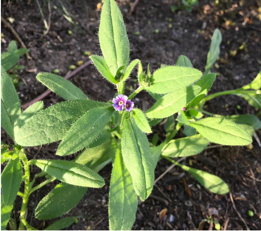
Paddfot vid Årstabron.